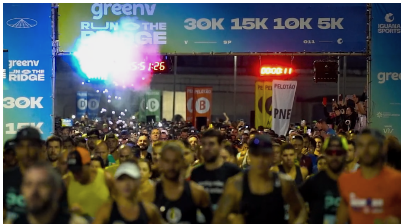
São Paulo, Run The Bridge 2023

GRI é o Global Reporting Initiative, uma organização internacional de padrões independentes que ajuda empresas, governos e outras organizações a compreender e comunicar os seus impactos ambientais e em alterações climáticas.