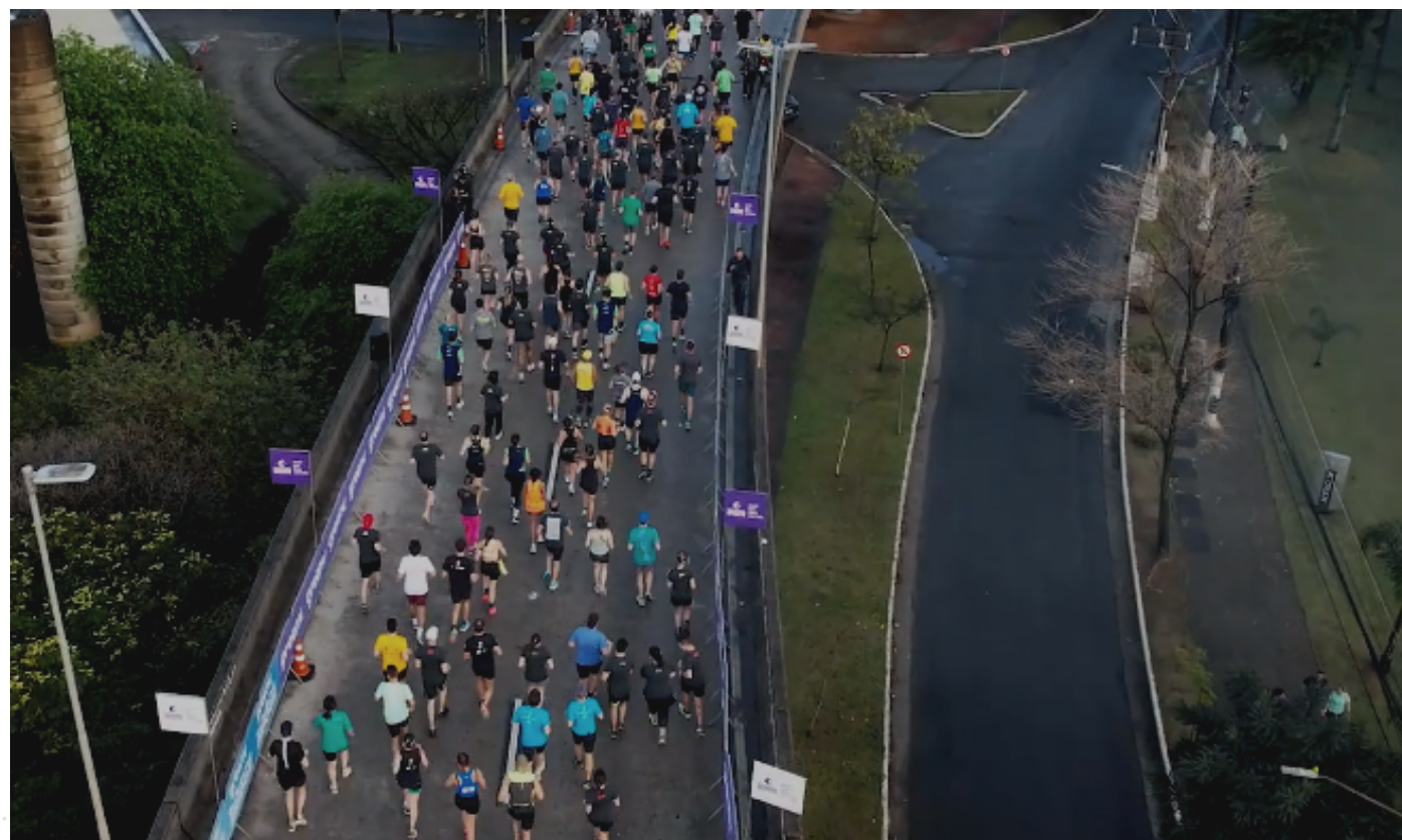
Largada com mais de 4.600 participantes

O crédito é verificado pela Certificadora TUV Rheinland nos moldes definidos pelo artigo 3o , XXVII, da Lei no 12.651/2012 do Código Florestal Brasileiro e utilizado para comprovar a contribuição com a preservação ambiental.