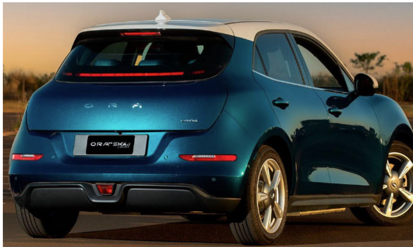
Ora 03 Skin o novo elétrico da GM

Vamos juntos nesse movimento rumo a um futuro mais verde